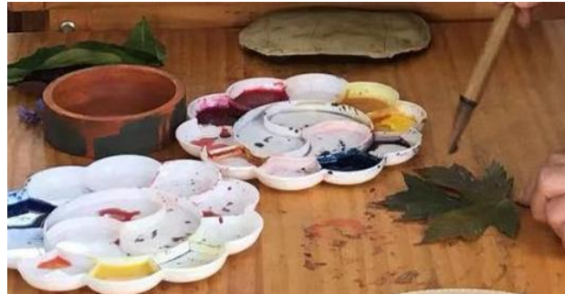
（树叶传拓所需的材料：各种形状的树叶、中国绘画颜料、毛笔等）