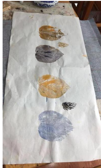
（学生的树叶传拓作品）

第五步，老师示范并指导学生在拓好“瓦当”的宣纸上书写隶书“一叶知秋”，完成作品。