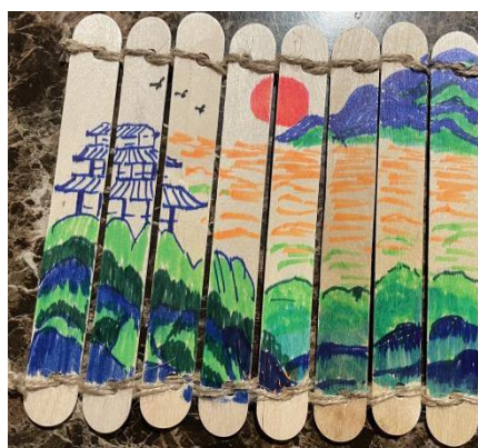
(老师制作的简书教具)