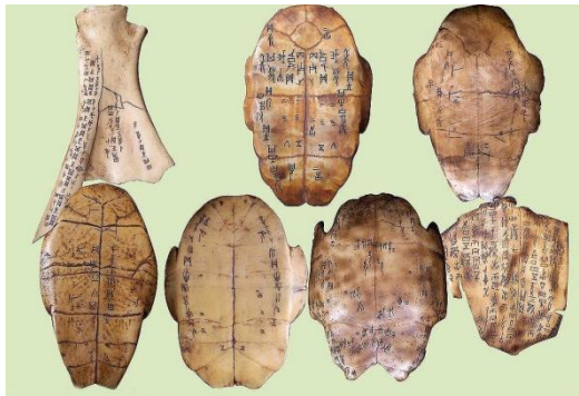
（甲骨文：图片来自网上）

由于教学对象为低龄儿童，因此为了使教学内容生动形象化，老师准备了图片和自制教具。