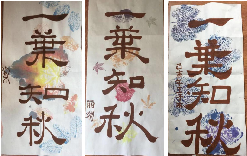
(学生作品：隶书“一叶知秋”)

教学效果小结：基本实现了教学目标，完成了教学内容。教学过程中学生们表现出浓厚兴趣和参与热忱。本设计适用于小学及初中学生。