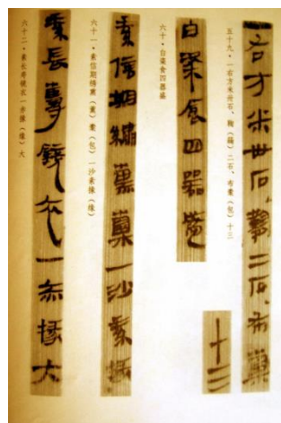
(古代简牍书)