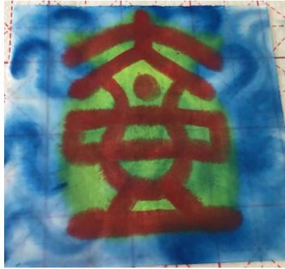
（学生作品：篆书“壶”字）

们讲述“壶中日月长”的传说故事，并将其表现到纸上，强化学生们对篆书的书写规则及汉字字形的把控能力。