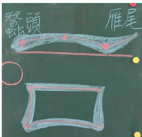
(示范隶书的书写规则：蚕头雁尾)

第三步，简单介绍传拓艺术在书法发展与中华文明进程中的作用。传拓是古代人们用纸、墨等工具将铸刻在钟鼎、石碑等器物上的文字或者图文拓印到纸上的一种技艺，可谓古代的复印技术，对中国古代四大发明之一——印刷术的产生有着不可磨灭的启示作用。拓片的产生使得历代书法碑刻名迹得以妥善保存和流传，为书法艺术的传播与发展做出了直接贡献。