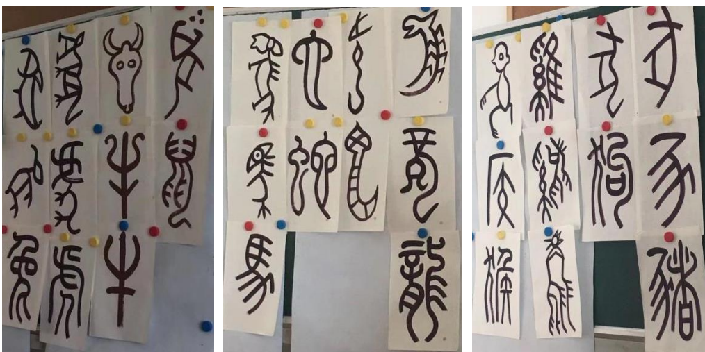
（老师示范作品：篆书“十二生肖”部分）

教学中需要注意：如果学生自己的生肖汉字太难写，可以让他选择书写他喜欢的动物的汉字或者他的一位家人的生肖汉字。不要让初拿毛笔的孩子因为汉字的笔画过于复杂而感到受挫。